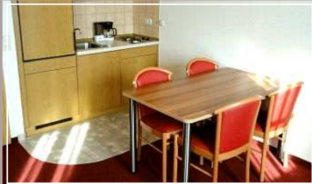
Sitzecke und Kochbereich in allen unseren Apartments