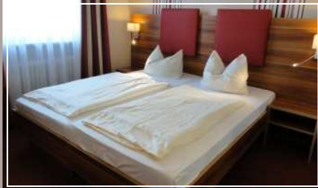
Komfortable Doppelbetten mit Rückenlehne und Leselicht