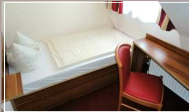
Die Apartments verfügen über einen zweiten Schlafraum